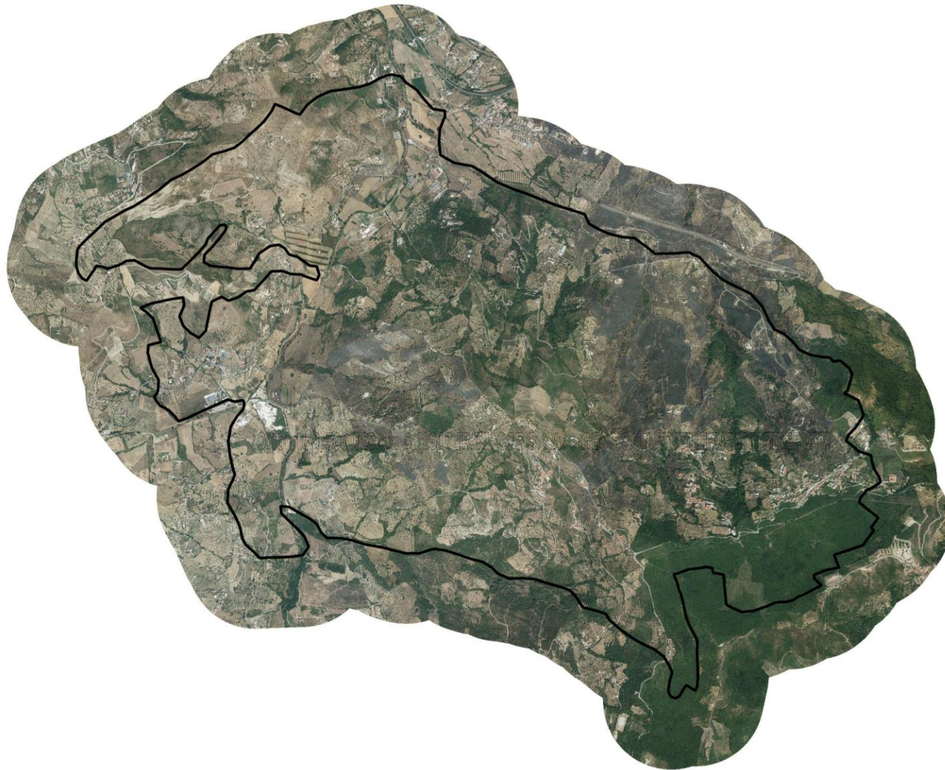
Fig. 1 – Il territorio di Laureana Cilento