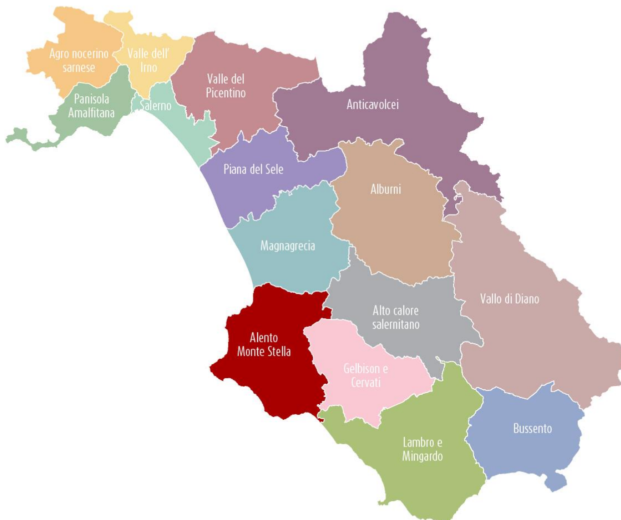
Fig. 1 – L'ambito STS dell'Alento Monte Stella

Il comune di Laureana Cilento appartiene alla provincia di Salerno e rientra nell'ambito territoriale di riferimento del Cilento. Il comune vicino alle famose mete turistiche di Agropoli e Castellabate appartiene al Sistema Territoriale di Sviluppo (STS) “ A3 Monte Stella ” a “dominante naturalistica”. Allo stesso STS appartengono oltre ai comuni di Agropoli e Castellabate, citati precedentemente, anche i comuni di: Casal Velino, Cicerale, Laureana Cilento, Lustra, Montecorice, Ogliastro Cilento, Omignano, Perdifumo, Prignano Cilento, Rutino, San Mauro Cilento, Serramezzana, Sessa Cilento, Stella Cilento, Torchiara. Il territorio del STS è bagnato ad ovest dal Mar Tirreno, ed interessa un tratto di costa che va dalla parte meridionale del Golfo di Salerno alla foce del Fiume Alento. Punta Licosa è il punto più occidentale del piccolo promontorio occupato dal STS, caratterizzato da una morfologia collinare, con i rilievi più alti che culminano nel Monte della Stella (1131 metri s.l.m.), posto in posizione baricentrica.